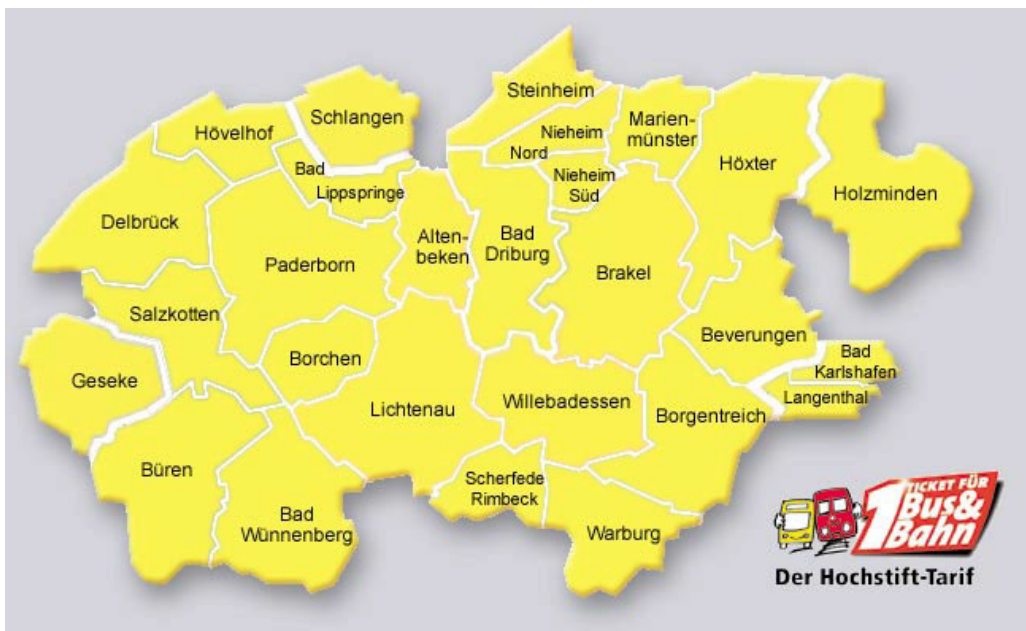
Abbildung 2 Verkehrsverbund Paderborn/Höxter nach [VPH04]

Telefon: (+49 175) 244 16 96 E-Mail: jan.lackmann@web.de